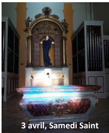
3 avril, Samedi Saint