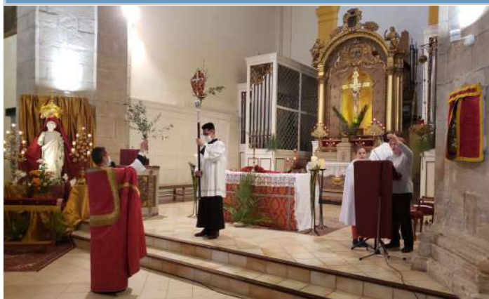
28 mars, Dimanche des Rameaux