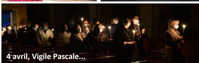
4 avril, Vigile Pascale...