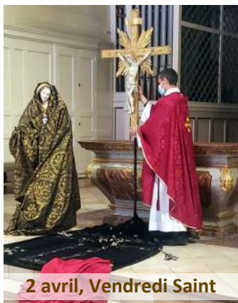
2 avril, Vendredi Saint