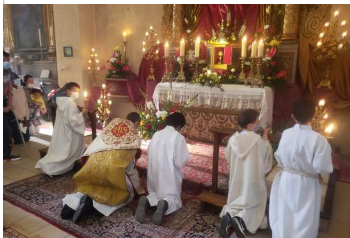
1 er avril, Jeudi Saint